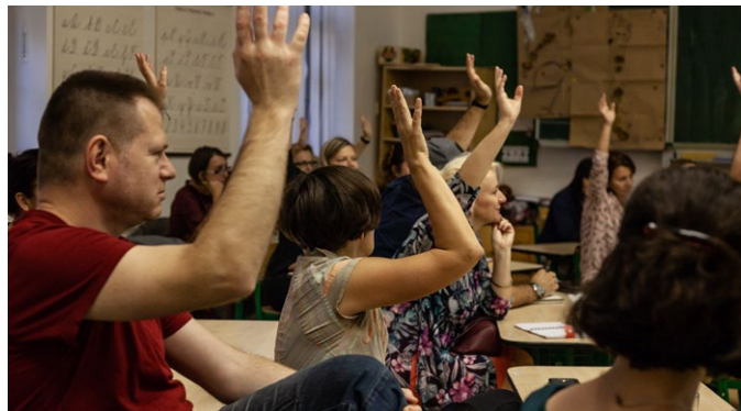
Workshop pro rodiče „Děti online – Vše, co rodiče potřebují vědět o online světě dnešních dětí“ v Brně.

Před nástrahami, které na děti číhají v online světě, jsme upozornili i formou workshopu pro rodiče . Uskutečnil se 24. října v Brně ve spolupráci s organizací Replug me pod názvem „ Děti online – vše, co rodiče potřebují vědět o online světě dnešních dětí “. Potěšila nás zejména aktivní participace účastníků, kteří využili příležitosti seznámit se s online nebezpečím, jež může jejich děti na internetu potkat. Zcela konkrétně a prakticky jsme se věnovali hlavně radám, jak takovému nebezpečí účinně předcházet.