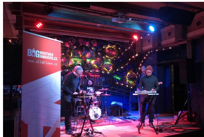
Mezinárodní kapela death ponee hraje na večírku k vyhlášení BBA 2019 v klubu Cross.