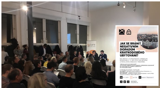
Zcela zaplněná Galerie 1, kde jsme uspořádali ve spolupráci s MČ Praha 1 panelovou diskusi k problematice negativních dopadů krátkodobého ubytování.

V oblasti implementace GDPR v SVJ a BD jsme se v návaznosti na aktivity realizované v roce 2018 soustředili zejména na poskytování právního poradenství a osvětu v konkrétních oblastech zpracování osobních údajů. Oproti roku 2018 šlo v podstatně menší míře spíše o poskytování poradenství týkajícího se konkrétních problémů, nikoli o celkové implementace GDPR a zpracování příslušné dokumentace. Celkem byly zejména osobní konzultace poskytnuty v 16 případech . K tématům projektu jsme také publikovali několik osvětových a odborných článků, v časopisech jako je, Hobuleť, Pražský senior, Jedna apod.