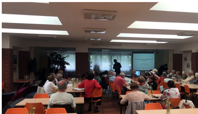
Právník luRe přednáší na semináři „Bydlení a právo“ pro seniory.

Paní F. (1956, Liberecký kraj) si před několika lety vzala revolvingový úvěr. Bohužel, i přes řádné splácení po ní věřitel požadoval stále vyšší splátky, které narostly do neúnosné výše něko-