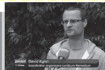
Zdroj: 10. 7. 2009, TV Prima, Zprávy pražským zaměstnancům bezplatné právní rady i zastupování u soudu. Zpráva věnovaná právní pomoci luRe v hlavních Zprávách TV Prima dne 10. 7. 2009

„Teď tu mám dobrou zprávu pro lidi, kterým třeba jejich šéf posílá pozdě výplaty, krátí svévolně dovolenou nebo je nutí pracovat zadarmo přesčas. Bránit se u soudu zatím stálo nervy i peníze, teď to může být jinak. Existuje nový unikátní projekt, který nabízí mimo-