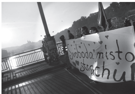
Čelo průvodu karnevalu Freedom not Fear

Podařilo se nám dosáhnout toho, že Rada vlády pro lidská práva doporučila vládě odstranit novelu shromažďovacího zákona, která plošně zakazuje maskování účastníků shromáždění . Bylo to velké vítězství našeho návrhu, který čelil velké nevoli a bouřlivé diskusi zastánců tvrdšího postupu proti „problémovým“ shromážděním.