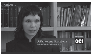
Zdroj: 18. 3. 2009, TV Nova, Na vlastní oči

Iuridicum Remedium si za pět let usilovné práce vybudovalo pozici vyhledávaného a spolehlivého novinářského zdroje . Spolupráce s médii je pro nás velkým pomocníkem při řešení kauz, poukazování na problémy i budování renomé seriózního partnera k diskusi. Novináři luRe oslovují s žádostí o komentáře a stanoviska především k ochraně soukromí a pracovní právní problematice , poslední dobou též k nešvarům při exekucích . Z jednotlivých témat nás média nejčastěji kontaktovala ohledně sledování zaměstnanců na pracovišti, kamerových systémů, tzv. inteligentních karet, komunikace na sociálních sítích nebo nakládání s DNA