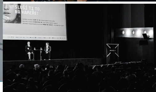
Zaplněné Oko a diskuze o kamerách rozpoznávající tváře.