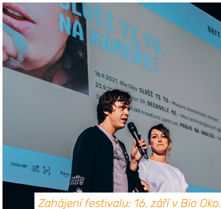
Zahájení festivalu: 16. září v Bio Oko.

Tou největší akcí byl však podzimní Big Brother Film Festival : tři večery plné filmů a diskuzí, které navštívily více než dvě stovky návštěvníků