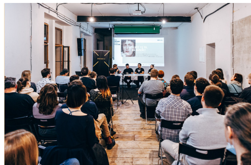
Druhý večer, 23. září: diskuze o technologických gigantech v Prostoru 39.