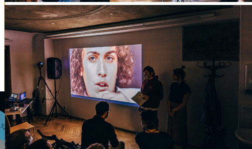
Závěrečný večer, 30. září. Pražské kreativní centrum a Právo na analog.