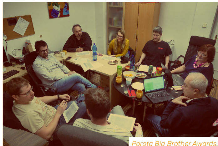
Porota Big Brother Awards.